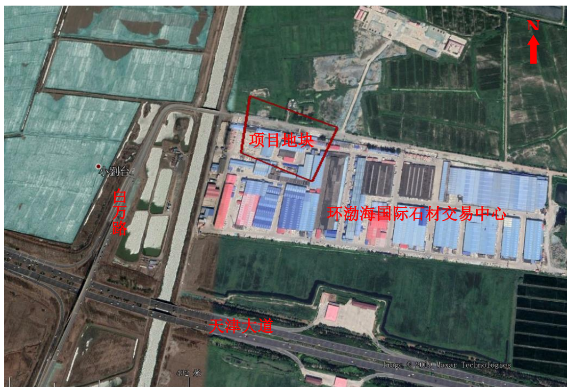
图 1.1 地块地理位置示意图

地块地理位置示意图见图 1.1，调查地块边界拐点坐标见表 1.1，地块调查范围见图 1.2。